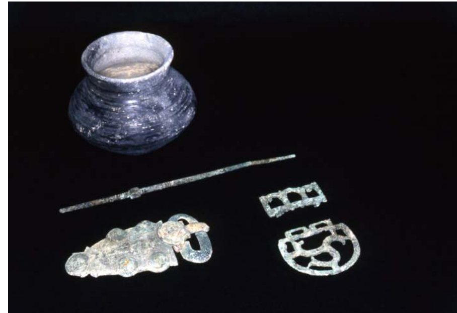
Archives CRAVF et Regnard, 2001